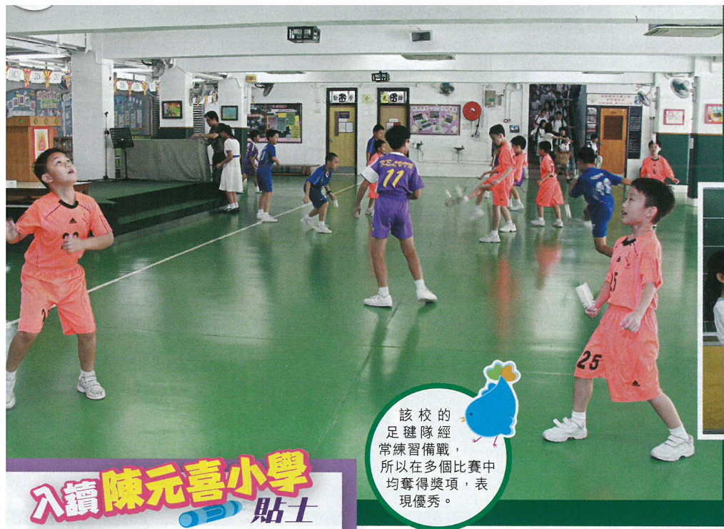
該校的足球隊經常練習備戰，所以在多個比賽中均奪得獎項，表現優秀。