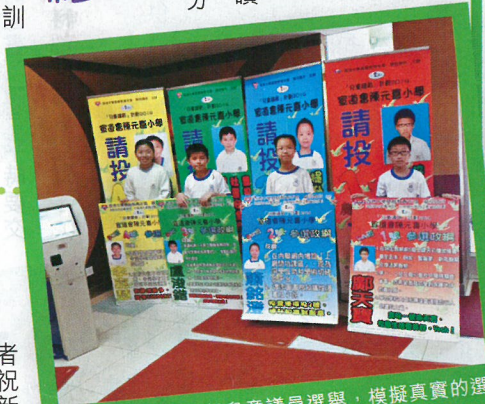
▲該校每年會舉行兒童議員選舉，模擬真實的選舉情況，加深學生對社會時事的認識。

「我哋學校每星期有一次午讀時間，每次約半小時，我向低年級嘅學生講英文故事，目的係想畀多啲 fun 佢哋，提高佢哋對閱讀嘅興趣。」此外，該校每日都設有早讀環節，而老師就會每星期與學生分享故事。