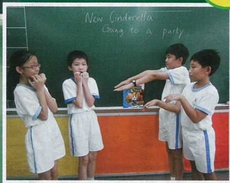
▲將戲劇教育滲入課程內同樣是該校的特色，以此提升學生的學習動機，加強他們的表達和傳意技巧等能力。