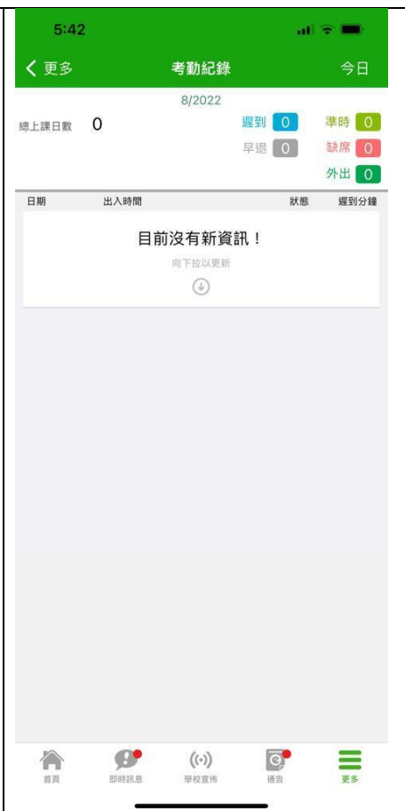
「考勤紀錄」記錄缺席、遲到及早退資料