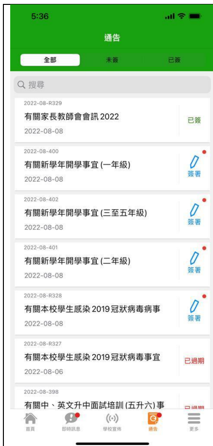
家長可以密碼簽署通告