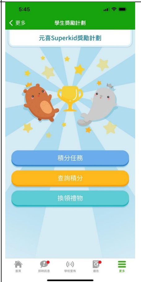
學生獎勵計劃可以查詢積分和換領禮物