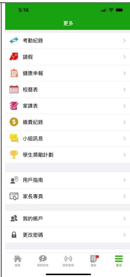
更多顯示更多功能